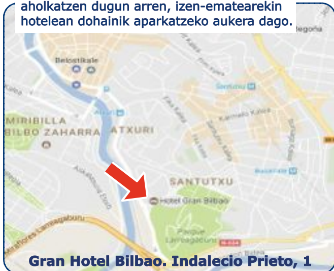
Gran Hotel Bilbao. Indalecio Prieto, 1

Kokapena: Garraio publikoa erabiltzeko aholkatzen dugun arren, izen-ematearekin hotelean dohainik aparkatzeko aukera dago.